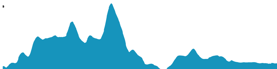
PROFIL DE DÉNIVÉLÉ