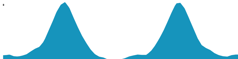
PROFIL DE DÉNIVELÉ