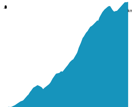
PROFIL DE DÉNIVELÉ