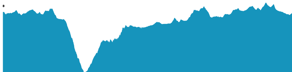
PROFIL DE DÉNIVELÉ